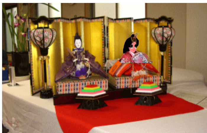
3月2日(水) 3日(木) ひな祭り

あかりをつけましょ ぼんぼりに お花をあげましょ 桃の花 五人ばやしの 笛太鼓 今日はたのしいひな祭り